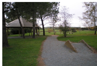
Parcours de santé