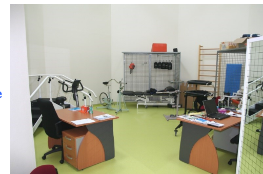
Salle de kinésithérapie